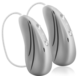
sound E-R in Originalgröße abgebildet

Erleben Sie die wichtigen Momente und wählen Sie gemeinsam mit Ihrem Hörakustiker aus fünf verschiedenen Leistungsstufen, die für Sie passende aus!